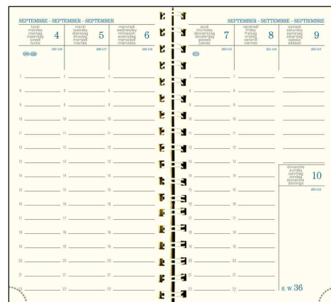
Agenda de poche SAD 16W Lincolor, grille