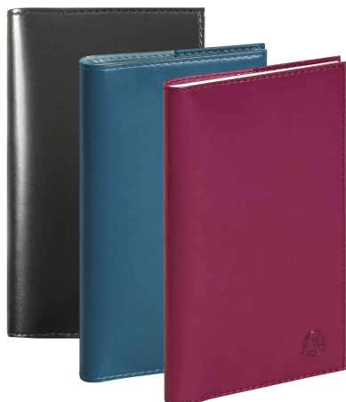
Agenda de poche "SAD 16S" VERONE, assorti