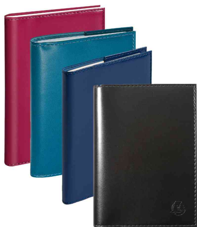
Agenda de poche "SAD 13S" VERONE, assorti