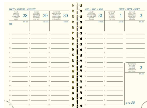
Agenda de poche SAD 13W Lincolor, grille