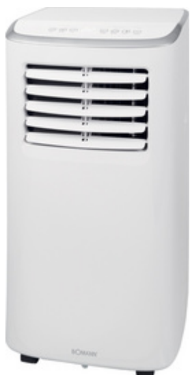
Climatiseur CL 6061 CB