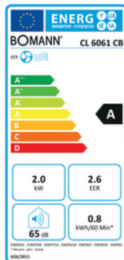
Classe d'efficacité énergétique : A