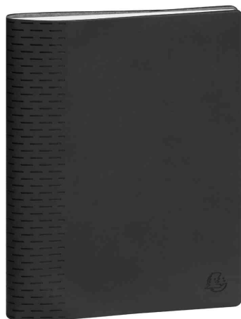
Agenda semainier "SAS 22 Non Stop" WINNER, noir