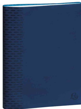
Agenda semainier "SAS 22 Non Stop" WINNER, bleu marine