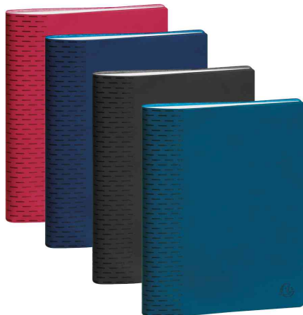
Agenda semainier "SAS 22 Non Stop" WINNER - assorti