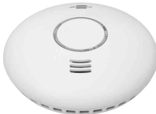
Détecteur de fumée connecté Wifi WRHM01, vue latérale