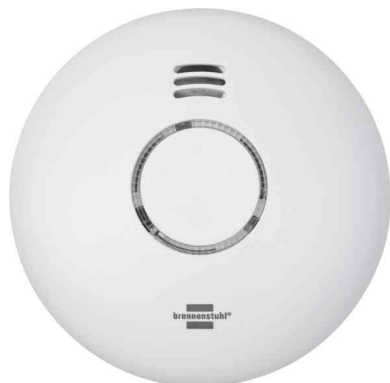
Détecteur de fumée connecté Wifi WRHM01