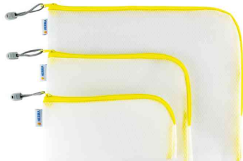
Visuel de référence : Mesh Bags, jaune

- pour ranger parfaitement des objets en vrac, à l'école, à l'université, au bureau et en voyage