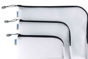
Visuel de référence : Mesh Bags, noir