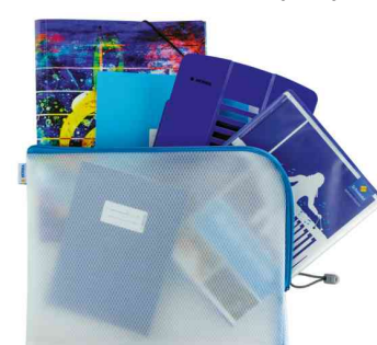
Visuel de référence : Exemple d'utilisation (360 x 280 mm)