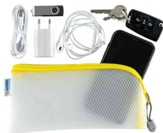
Visuel de référence : Exemple d'utilisation (230 x 110 mm)