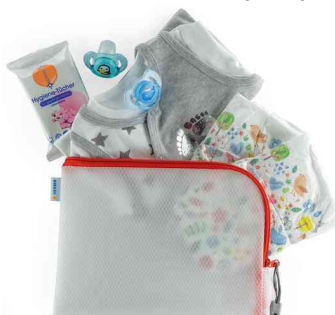
Visuel de référence : Exemple d'utilisation (260 x 200 mm)