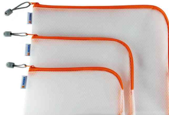
Visuel de référence : Mesh Bags, orange