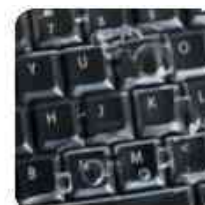
Visuel de référence: toucher agréable - lavable - protection en surface