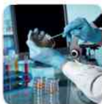
Visuel de référence: montre les utilisations possibles