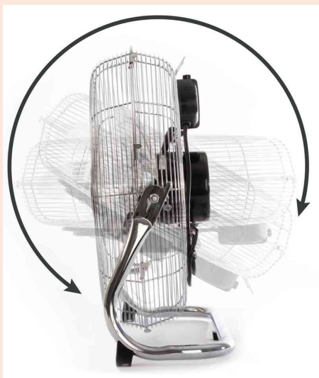
Visuel de référence : vue détaillée