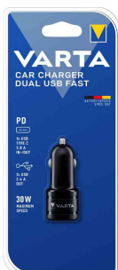
chargeur USB pour voiture "Car charger Dual"