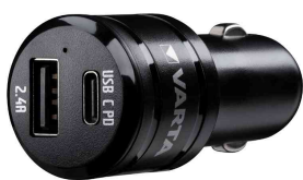
chargeur USB pour voiture "Car Charger Dual"