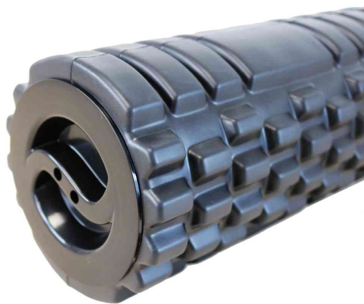
Vue détaillée: Structure en relief