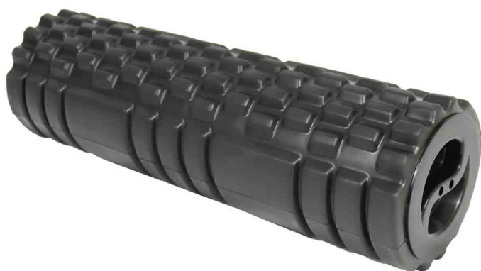
Repose-pieds ROLLER FEET