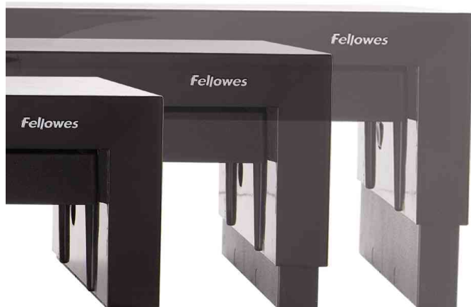
Support pour écran Designer Suites - hauteur réglable