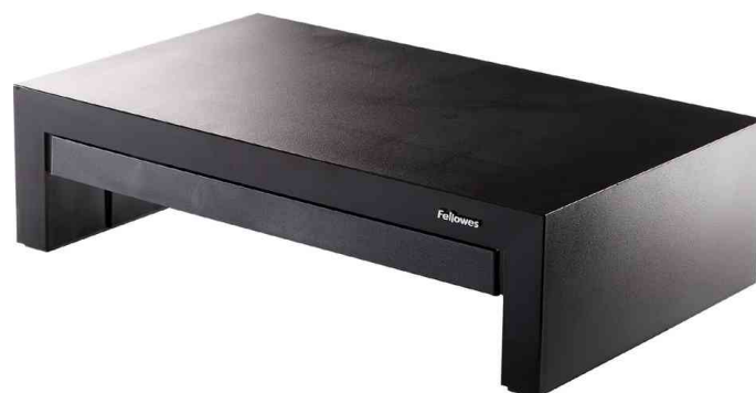
Support pour écrans Designer Suites