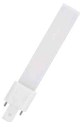
Visuel de référence: Ampoule LED DULUX® S, culot: G23