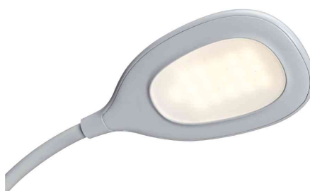
Montre la tête de lampe en détail