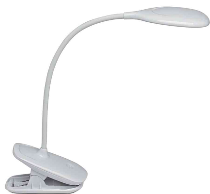
Lampe LED à pince MAULjack, rechargeable