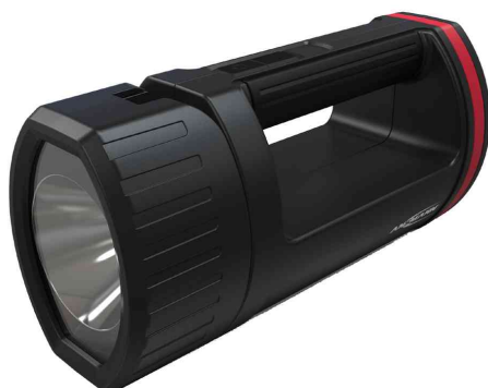
Projecteur portable LED rechargeable HS5R