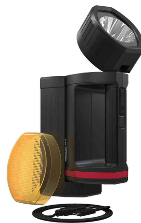
Projecteur portable LED rechargeable HS5R avec accessoires