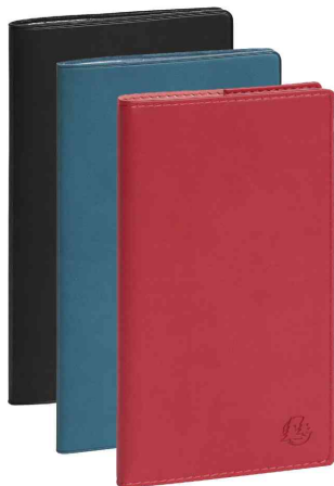
Visuel de référence: Agenda de poche "EXAPLAN 17" - 175 x 80 mm, assorti