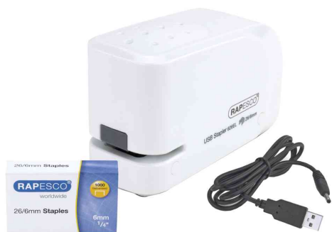
Agrafeuse électrique 626EL, blanc