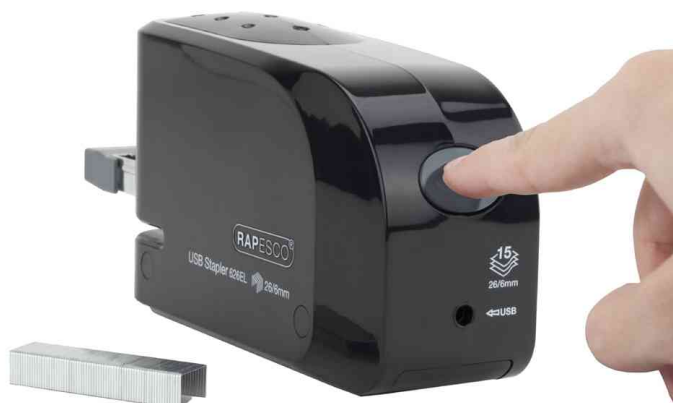
Visuel de référence: montre le bouton poussoir pour ouvrir la réserve d'agrafes