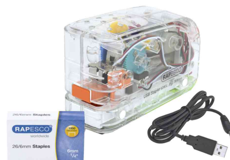
Agrafeuse électrique 626EL, transparent