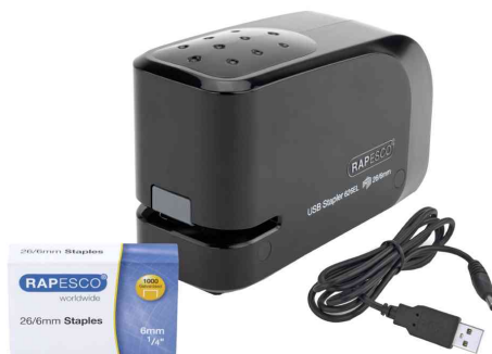
Agrafeuse électrique 626EL, noir