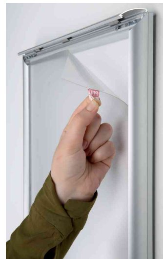
Visuel de référence: vue détaillée du film de protection anti-reflet