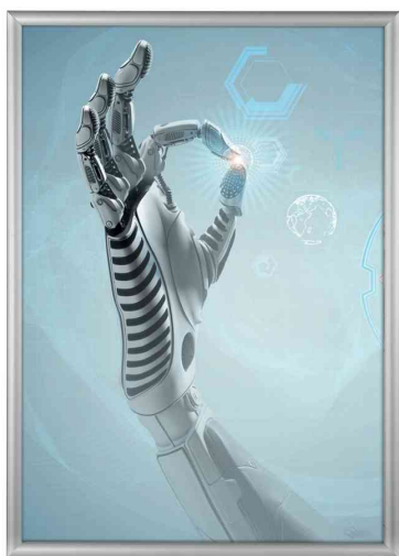
Vitrine d'affichage éclairée LED