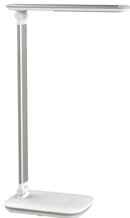
Lampe de bureau à LED MAULjazy, blanc