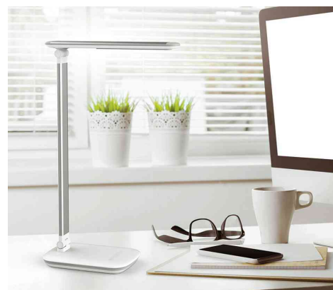
Visuel de référence: montre le produit en utilisation