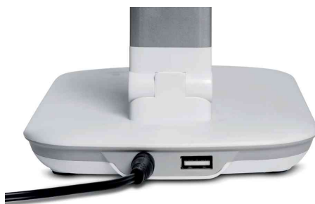
Vue détaillée: port USB