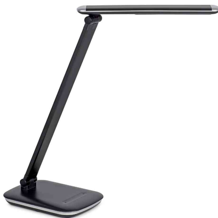
Lampe de bureau à LED MAULjazy, noir