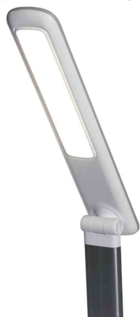
Vue détaillée: tête de lampe