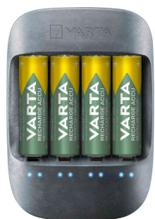
Chargeur de table "ECO CHARGER"

Contenu de la livraison : Eco Charger VARTA avec boîtier composé à 50% de matière biologique, avec 4 x piles rechargeables AA 2 100 mAh recyclées et câble d'alimentation avec fiche Euro