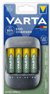
Chargeur de table "ECO CHARGER", emballage