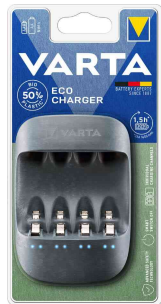
Chargeur "ECO CHARGER", emballage