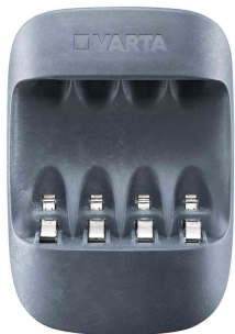
Chargeur "ECO CHARGER"

Contenu de la livraison : Eco Charger VARTA avec boîtier composé à 50% de matière biologique et câble d'alimentation avec fiche Euro