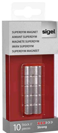
Cylindre aimanté néodyme "Strong" C5, kit de 10