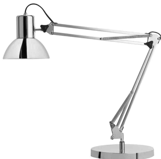
Visuel de référence: Lampe de bureau à LED SUCCESS 80, avec socle