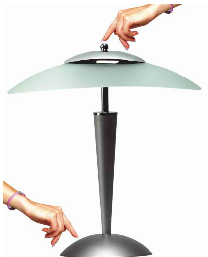
Lampe de bureau à LED CRISTAL (détail: interrupteur tactile)