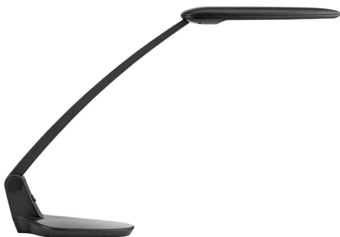
Lampe de bureau à LED BRIO 2.0