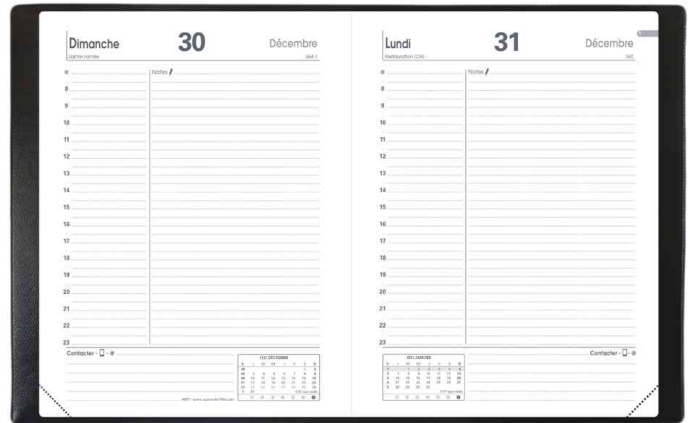
Agenda de poche "ABP 2", grille