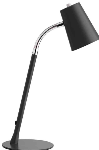
Lampe de bureau à LED FLEXIO 2.0, noir