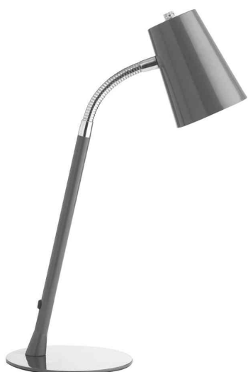
Lampe de bureau à LED FLEXIO 2.0, gris