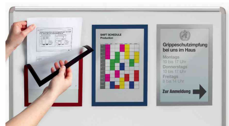
Visuel de référence: exemple d'utilisation