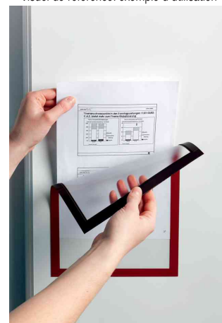
Visuel de référence: Utilisation simple