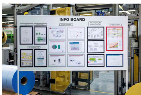
Visuel de référence: exemple d'utilisation