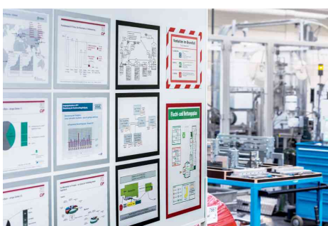
Visuel de référence: exemple d'utilisation