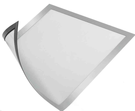
Cadre d'affichage magnétique DURAFRAME MAGNETIC, argent