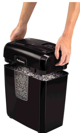
accessoire de coupe amovible