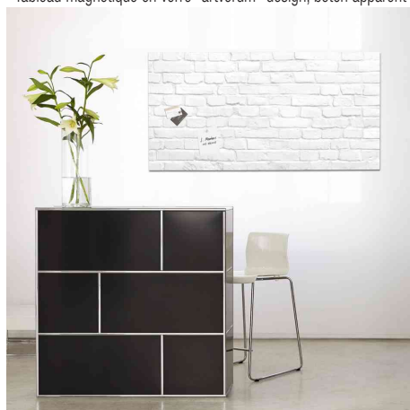
Visuel de référence: montre le produit en application