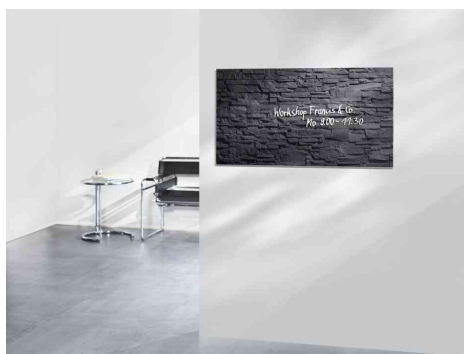
Visuel de référence: montre le produit en application