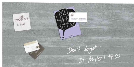
Tableau magnétique en verre "artverum" design, béton apparent