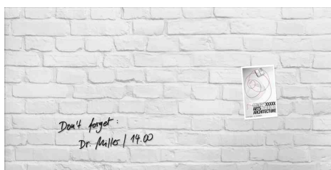
Tableau magnétique en verre "artverum" design, construction en brique