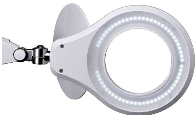
Vue détaillée: Tête de lampe