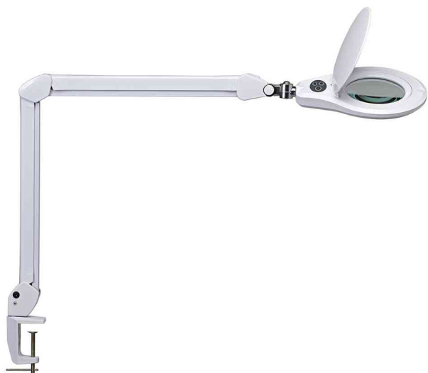
Lampe loupe à LED MAULsource