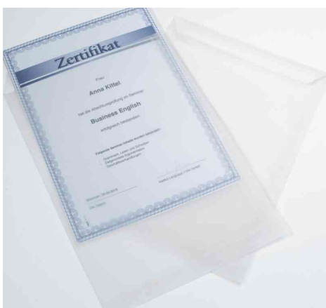
Visuel de référence: montre le produit en application