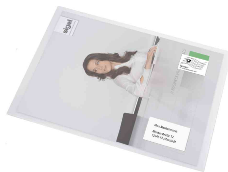
Visuel de référence: montre le produit en application