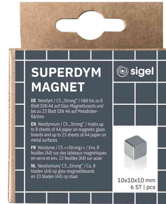
Cube aimanté Néodym "Strong" C5, kit de 6