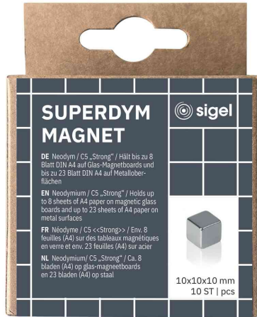
Cube aimanté Néodym "Strong" C5, kit de 10