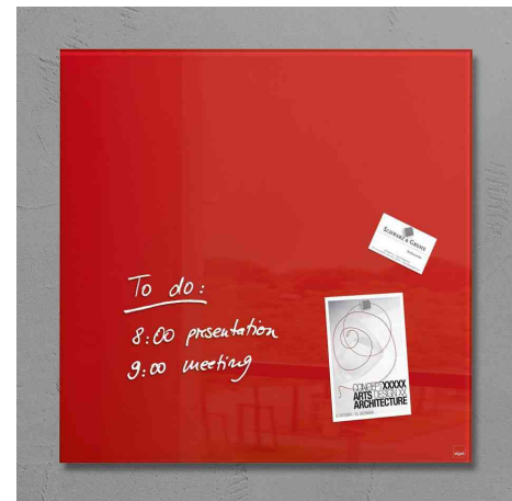
Visuel de référence: présente le produit en utilisation