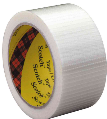
Ruban adhésif armé de cerclage 8959