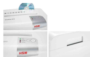
Détails: coupe CD séparées - touches de fonctionnement - partie supérieure amovible