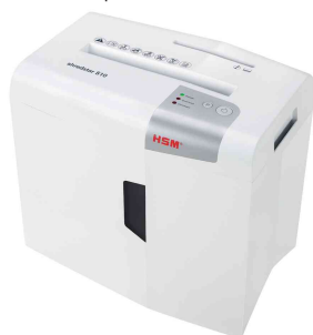
Destructeur de documents HSM shredstar S10

- pour une utilisation privée à domicile ou au bureau