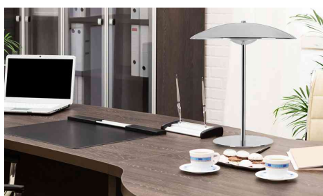
montre le produit en application