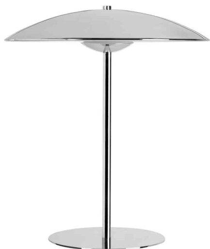
Lampe de bureau à LED à basse consommation ROMY, chrome