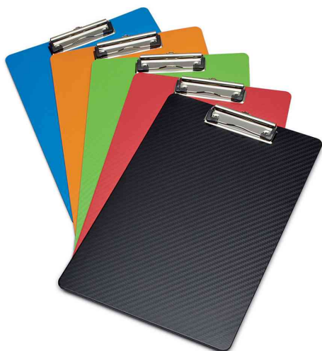
Visuel de référence: Porte-bloc à pince MAULflexx, choix des couleurs

- idéal pour des usages spéciaux: boulangeries, chambres froides et camions frigorifiques