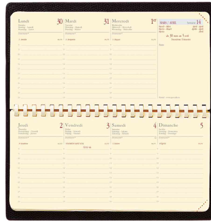
Agenda de poche "Planital", grille