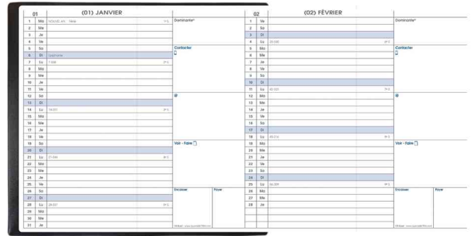
Agenda de poche "Minibest", grille