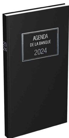
Agenda journalier Banquier Long - 1 volume