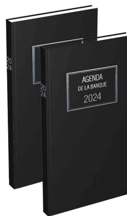
Agenda journalier Banquier Long - 2 volumes