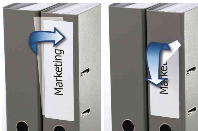
Etiquettes pour dos de classeur SPECIAL, utilisation