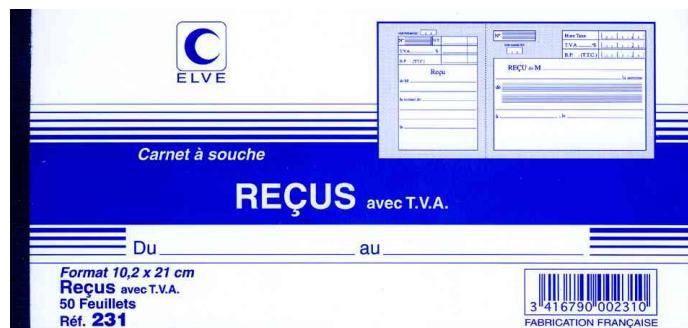
Carnet à souche "Reçu avec TVA"