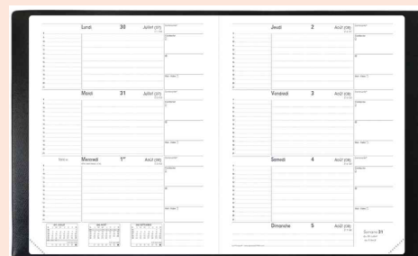
Agenda scolaire "Le Principal", 180 x 240 mm, grille