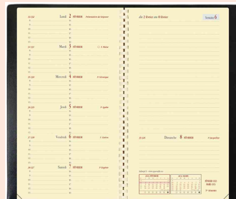
Agenda scolaire "Italsept S", 88 x 170 mm, grille