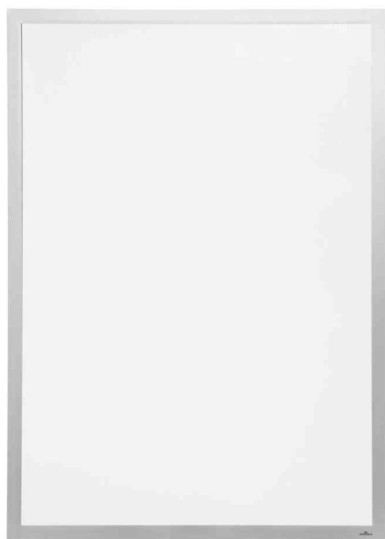
Cadre d'affichage DURAFRAME POSTER SUN, argent