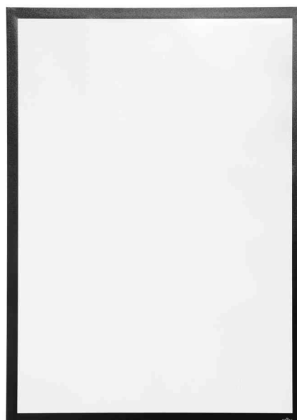
Cadre d'affichage DURAFRAME POSTER SUN, noir