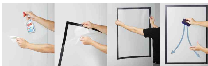
Fixation simple, sans bulles car auto-adhésif