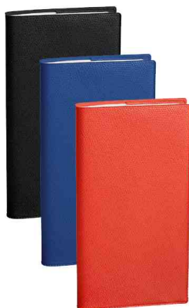
Agenda scolaire Sept-Bi, assorti