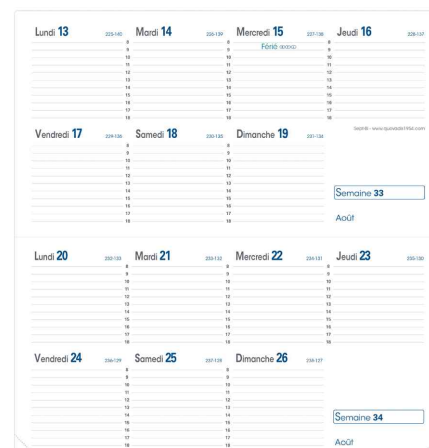
Agenda scolaire Sept-Bi, 88 x 170 mm, grille