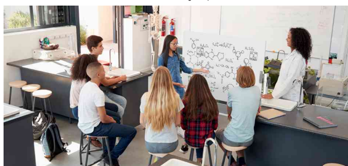
Visuel de référence: montre le produit en utilisation