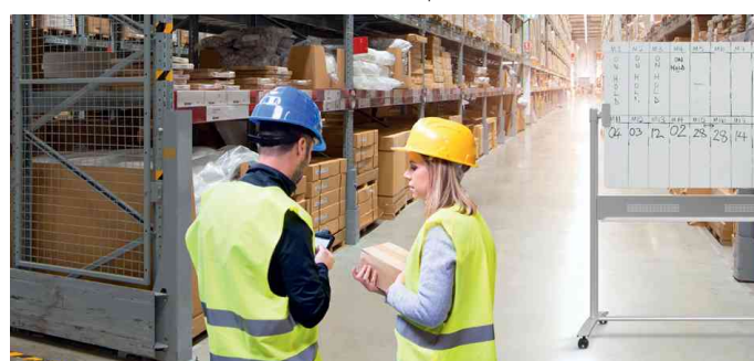
Visuel de référence: montre le produit en utilisation