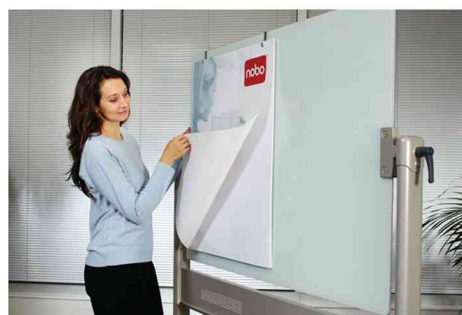
Visuel de référence: montre le produit en utilisation