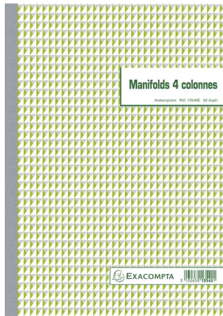
Visuel de référence: Manifold à colonnes