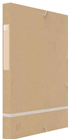
Sammelbox Touareg, 25 mm