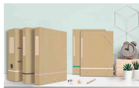
Visuel de référence : montre la gamme d'organisation TOUAREG